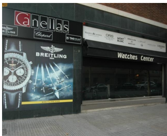
MASTER BLIND laqué RAL 9011 Noir MAT