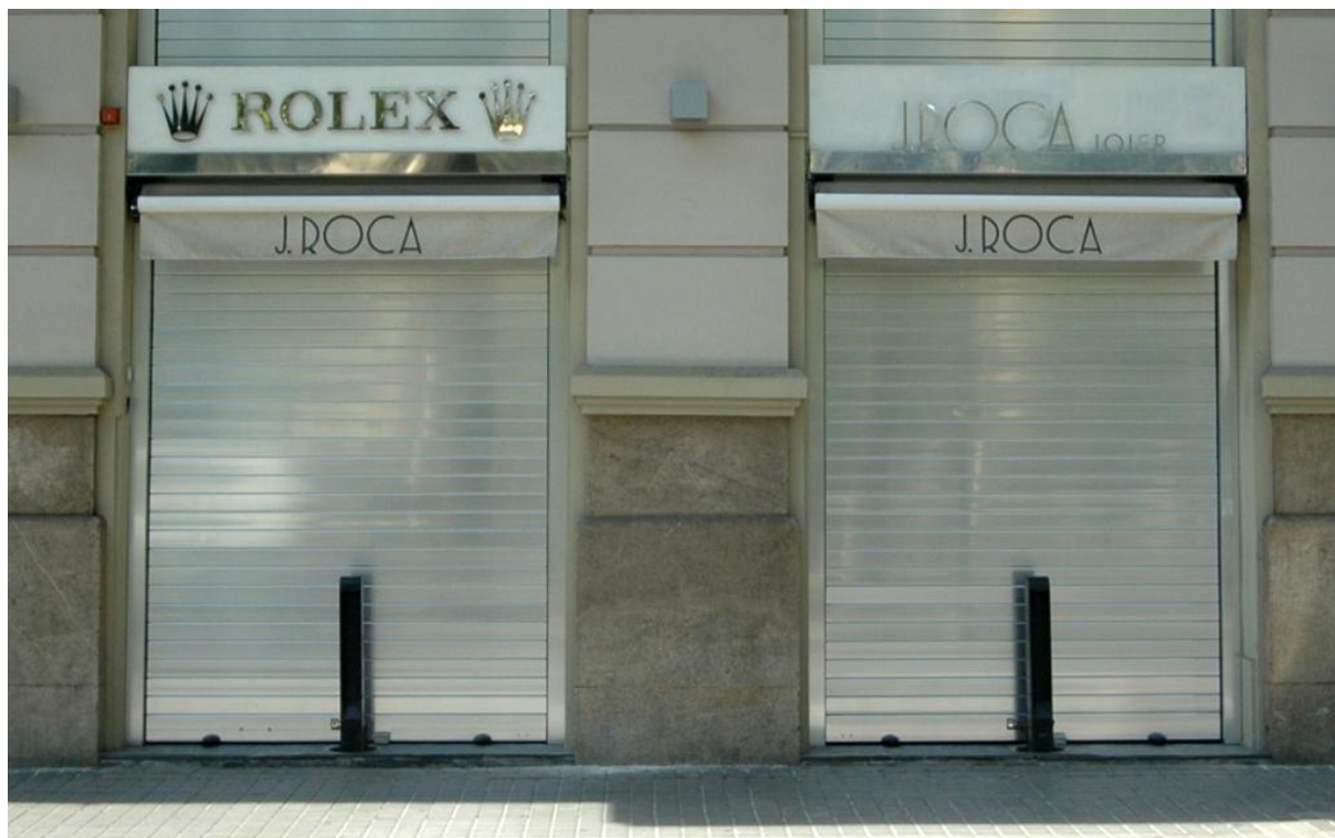
Mod. MASTER BLIND anodisé Argent Brillant