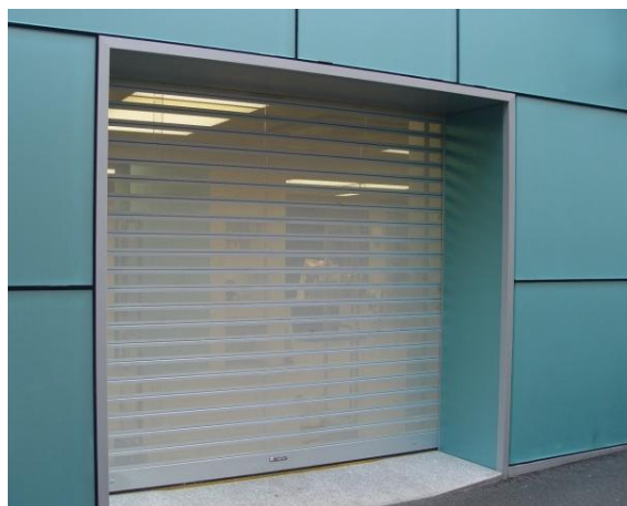
Mod. MICROPOLI laqué ARGENT MAT