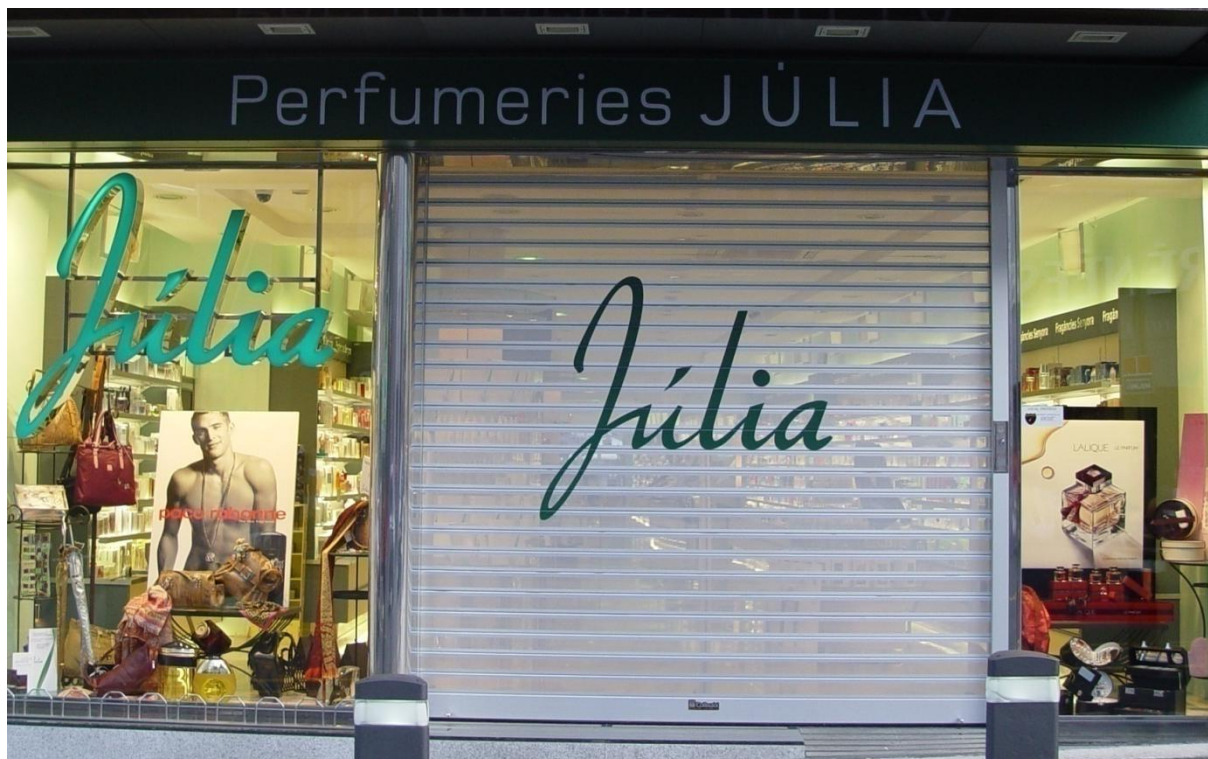
Mod. MICROPOLI laqué RAL 9010

Modernité et tendance pour votre commerce