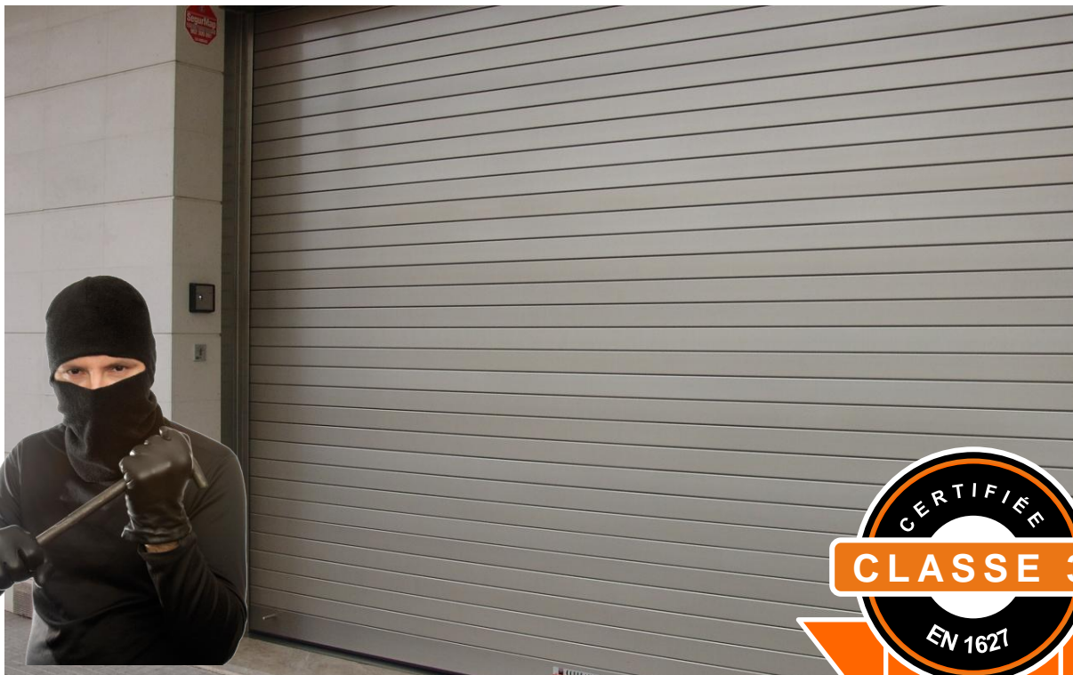
Mod. SECURBAIX en Anodisé Argent Mat