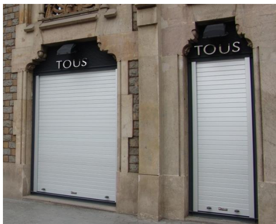
Mod. MASTER anodisé ARGENT MAT