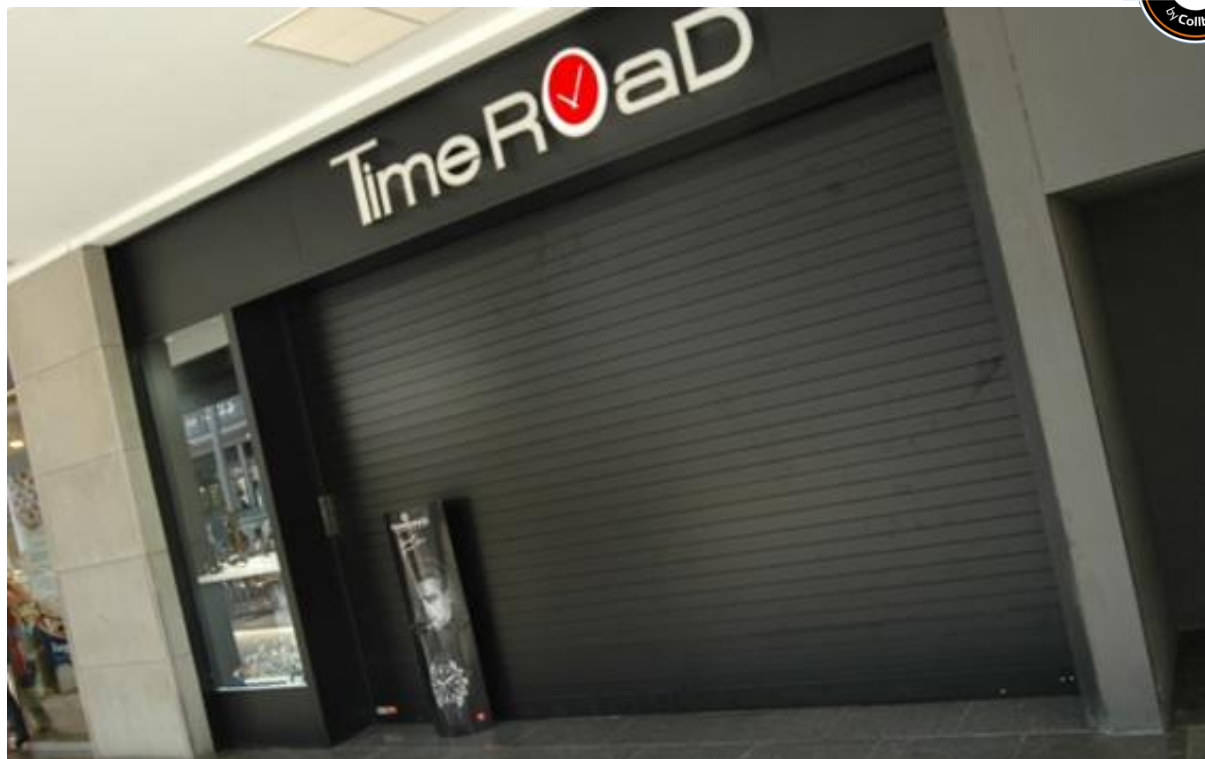
Mod. MASTER laqué NOIR MAT